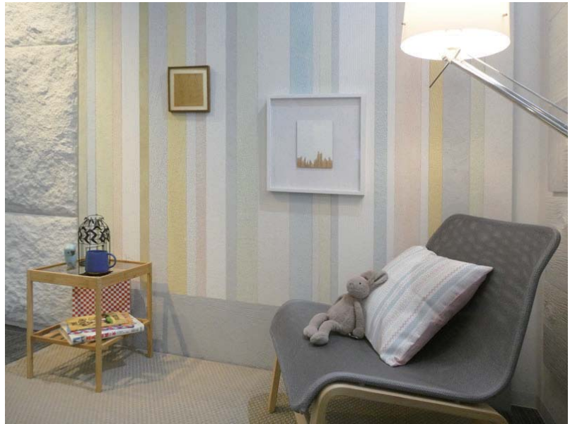
左官仕上アートパネル KINARI Pale tone Interior image