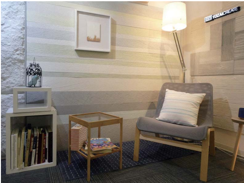
左官仕上アートパネル KINARI Pale tone Interior image