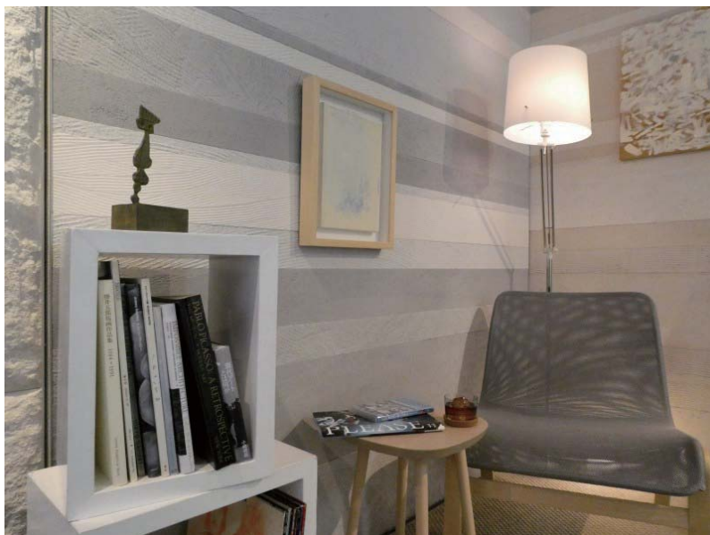
左官仕上アートパネル KINARI Basic Interior image