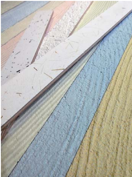
リブオーダー KINARI natural/Pale tone texture