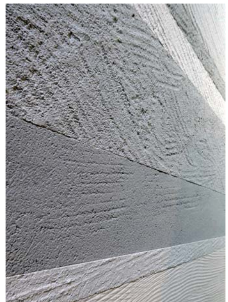
KINARI Basic texture